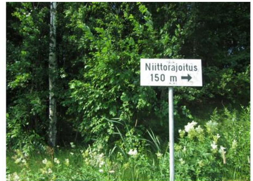
Kuva 15. Esimerkki niittorajoituksen merkintätavasta. Etelä-Suomi.